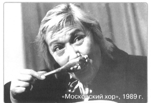
«Московский хор», 1989 г.