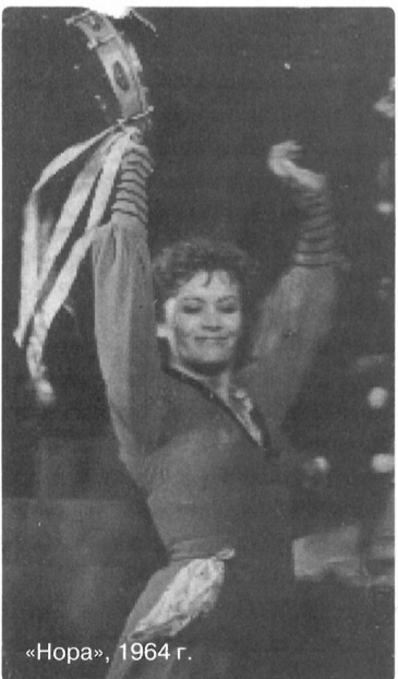
«Нора», 1964 г.

События, связанные с Верой Павловной, помнятся лучше все-