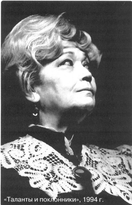
«Таланты и поклонники», 1994 г.

За полвека выросло не одно поколение театралов, для кого Анна Яковлевна Покидченко олицетворяет самое светлое в театре. Она стала символом не только «Красного факела», а театра вообще. Невещественный, неофициальный, неприсуждаемый титул «любимая актриса» подтвержден весомыми знаками: народная артистка СССР, кавалер Ордена Дружбы, лауреат премии «Человек года», почетный житель Новосибирска, национальное достояние России, лауреат Гран При конкурса «Парадиз» за особый вклад в развитие театра... В день своего бенефиса 7 января живая легенда выйдет на сцену, и не рухнут ли стены от оваций?