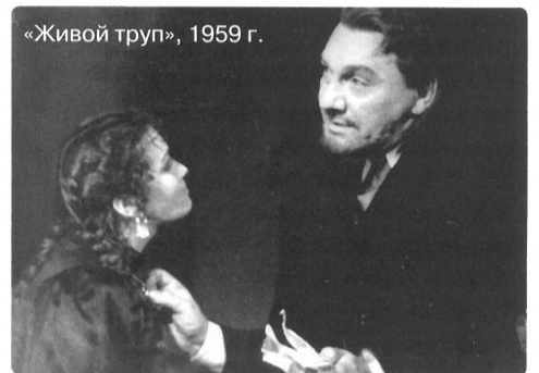
«Живой труп», 1959 г.