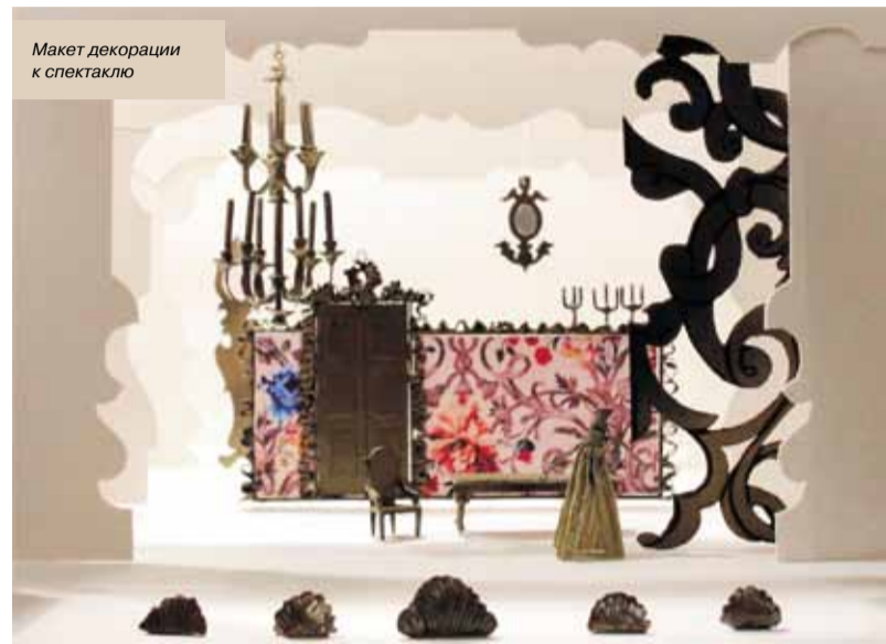
Макет декорации к спектаклю

Жан Батист Мольер. Мещанин во дворянстве. Комедия. Режиссёр-постановщик — Андрей Корионов, сценография и костюмы — Ирина Долгова, художник по свету — заслуженный работник культуры России Евгений Ганзбург, балетмейстер — Наталья Осипова, музыкальное оформление — Николай Якимов.