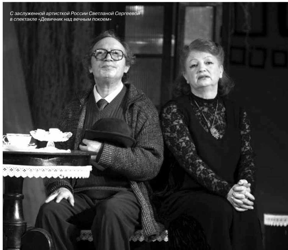
С заслуженной артисткой России Светланой Сергеевой в спектакле «Девичник над вечным покоем»