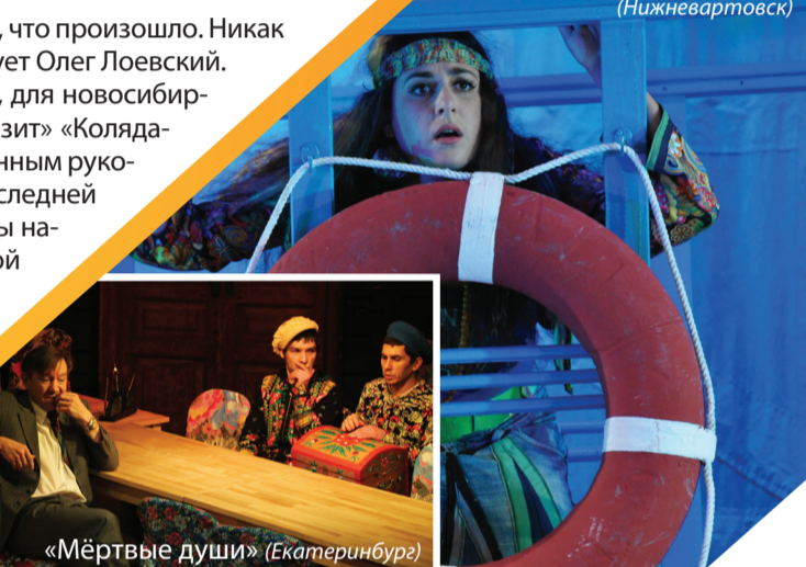
«Мёртвые души» (Екатеринбург)