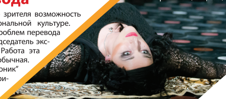
«Анна Каренина» (Хабаровск)