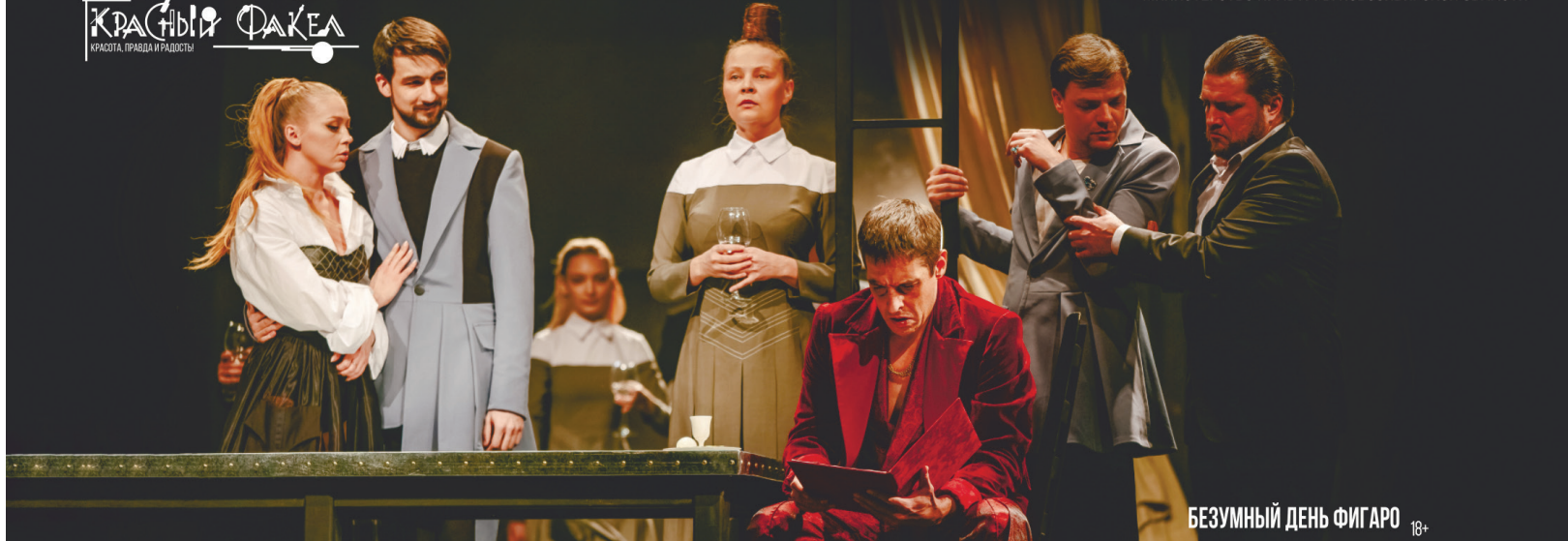
БЕЗУМНЫЙ ДЕНЬ ФИГАРО 18+