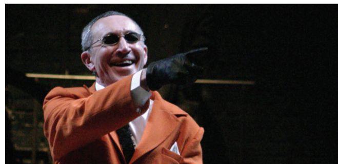
Поздравляем заслуженного артиста России Владимира Лемешонка с днем рождения! 27 февраля он отмечает 55-летие.

Персонажи этого веселого музыкального спектакля влюблены. Причем все до единого. Хитросплетения их любовного семиугольника сдобрены куплетами, ариями и дуэтами, сочиненными замечательным Юлием Кимом. Премьера состоится 27 февраля на малой сцене «Красного факела».