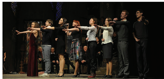
Выпускной курс Новосибирского государственного театрального института (мастерская театра «Красный факел») выпускает дипломный спектакль «Старинные амуры» по комедии Дениса Фонвизина.

Фотографии начала XX века с подписями можно присылать в театр на market@red-torch.ru (разрешение — от 300 dpi) или приносить в отдел маркетинга для сканирования до 15 марта.