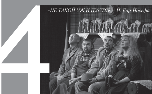
«НЕ ТАКОЙ УЖ И ПУСТЯК» Й. Бар-Йосефа