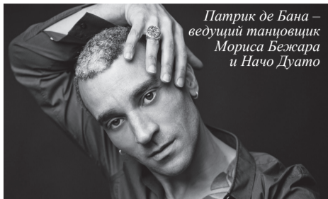
Патрик де Бана – ведущий танцовщик Мориса Бежара и Начо Дуато