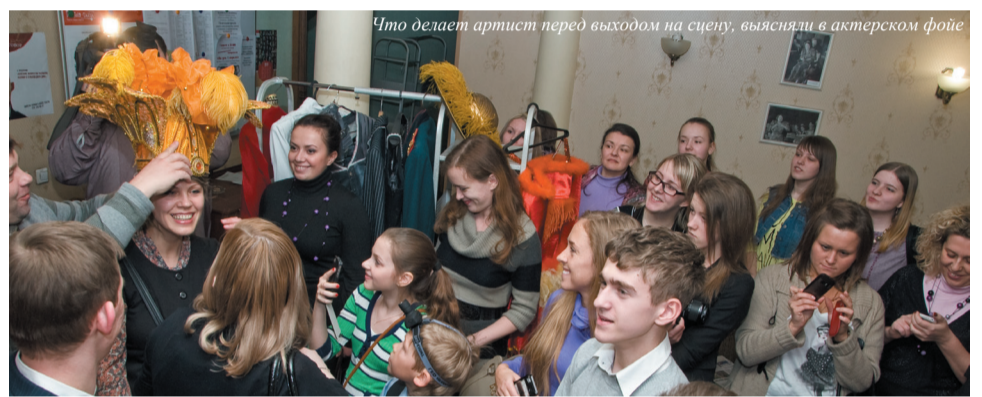
Что делает артист перед выходом на сцену, выясняли в актерском фойе