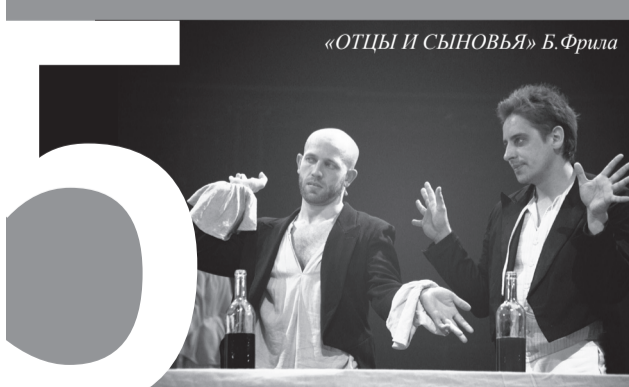
«ОТЦЫ И СЫНОВЬЯ» Б. Фрела