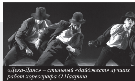
«Дека-Данс» – стильный «дайджест» лучших работ хореографа О.Наарина

тена. Реквием для солистов, смешанного хора, хора мальчиков, симфонического и камерного оркестров был написан Б. Бриттеном для церемонии освящения кафедрального собора в полностью разрушенном германскими бомбардировками городе Ковентри. Его исполнили впервые в 1962 году, и успех был настолько оглушительным, что Реквием разошелся за первые два месяца тиражом в 200 тысяч пластинок.