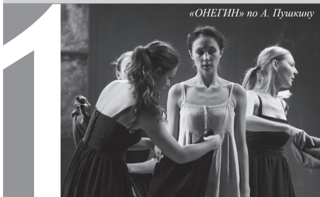
«ОНЕГИН» по А. Пушкину

Вы можете оставлять свои мнения и голоса уже сейчас в группе театра «ВКонтакте» и присылать их на электронный адрес редактора kguseva@ngs.ru. И будьте внимательны: в голосовании участвуют только актерские работы в премьерях сезона.