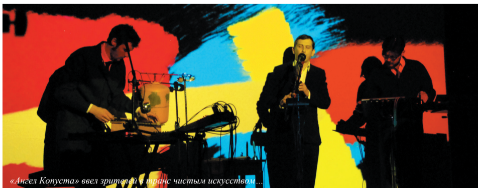
«Ангел Копуста» ввел зрителей в мир чистым искусством...