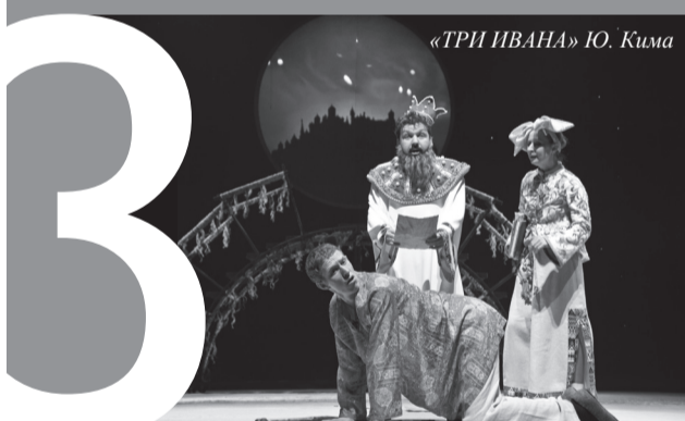
«ТРИ ИВАНА» Ю. Кима