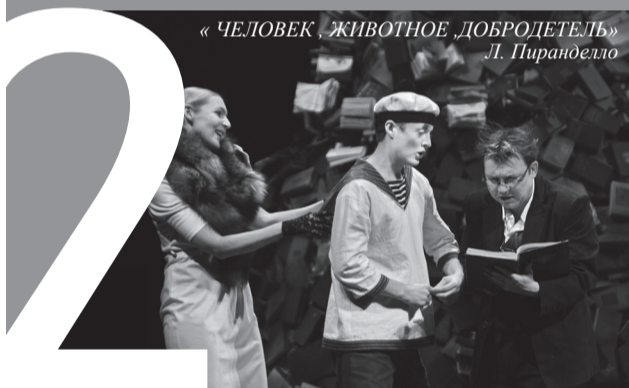
«ЧЕЛОВЕК, ЖИВОТНОЕ, ДОБРОДЕТЕЛЬ» Л. Пиранделло