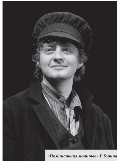
«Поминальная молитва» Г. Горина

— Мое детство пришлось на жуткие 90-е, а я был счастлив. Мне с того времени запомнился образ: мы с мамой жили в общежитии, у нас была маленькая комнатка, а в ней — большое окно. И все время в этом окне стояло солнце. Я смотрел в окно, и