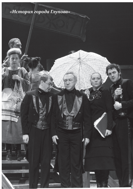
«История города Глупова»