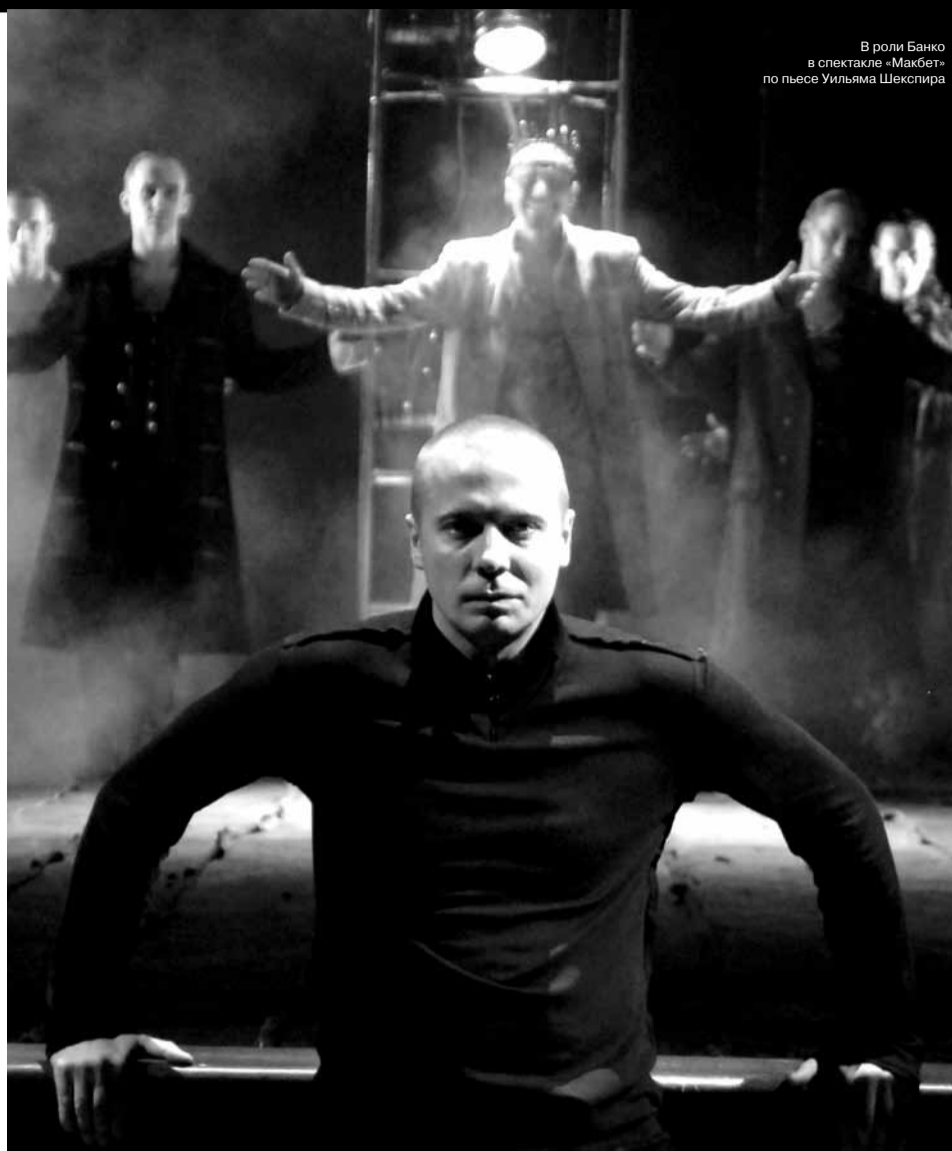
В роли Банко в спектакле «Макбет» по пьесе Уильяма Шекспира

— Честно скажу, не люблю, когда театр называют «храмом»: это звучит так, будто мы здесь отгораживаемся от того, что происходит вокруг. Но наша жизнь вне театра не может не влиять на профессию. Мы в неё всё приносим извне, а театр, в свою очередь, тянется за нами в жизнь. Даже, может быть, и хочешь отвлечься, но всё равно постоянно думаешь о работе. Бессмысленно себя обманывать, что можно от неё отгородиться. Ты вышел из театра, но репетиция продол-