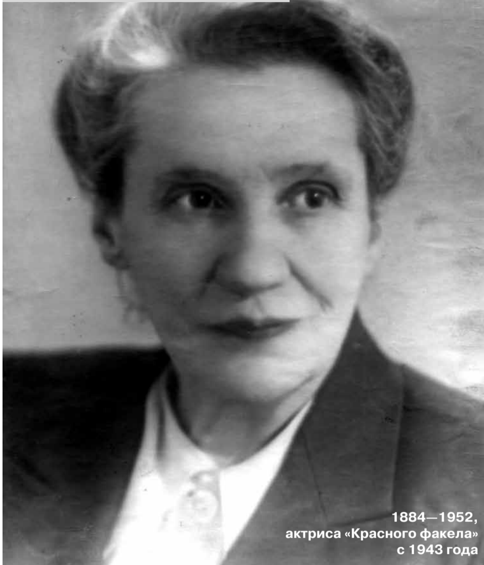
1884—1952, актриса «Красного факела» с 1943 года