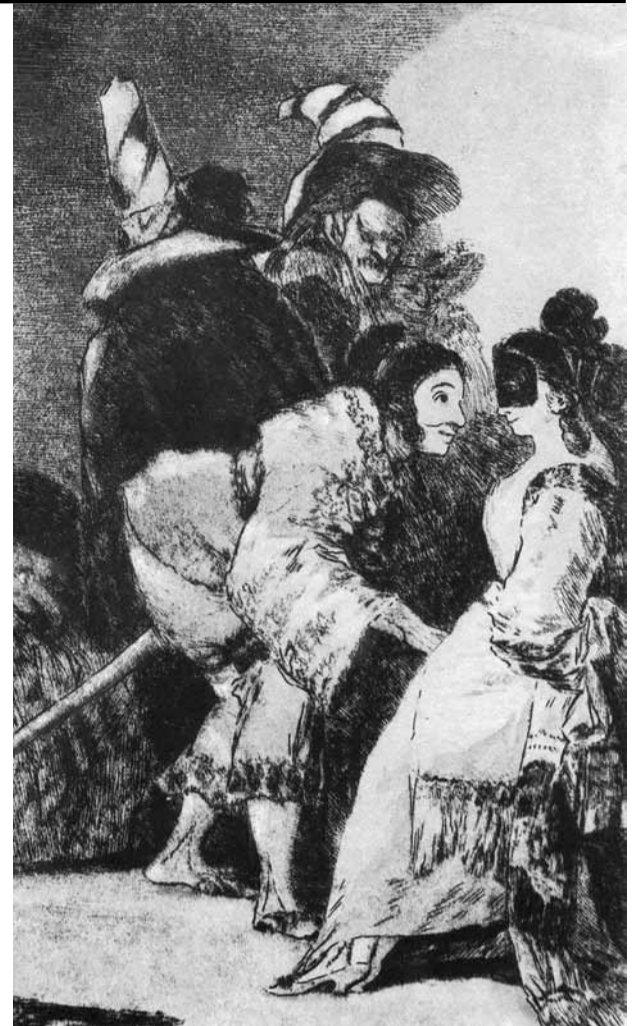
Свет — тот же маскарад. Лицо, одежда и голос — всё в нём притворно. Все хотят казаться не тем, что они есть на самом деле. Все обманывают друг друга, и никого не узнаешь.