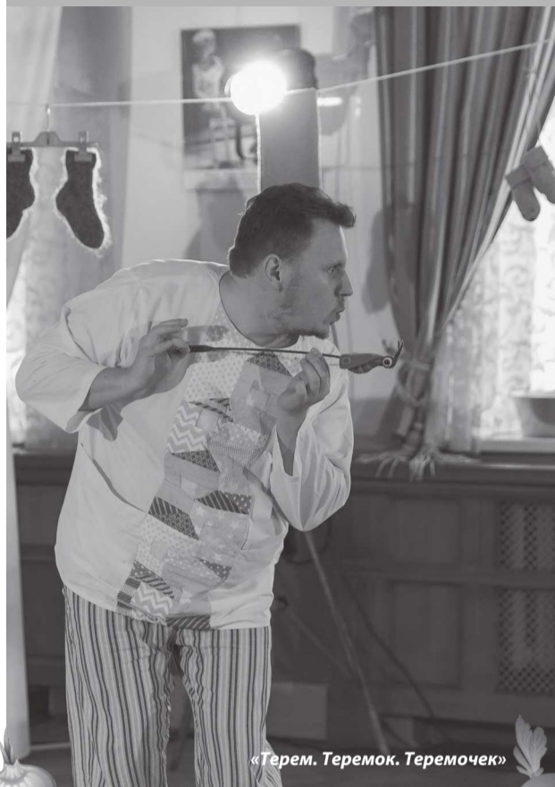
«Терем. Теремок. Теремочек»