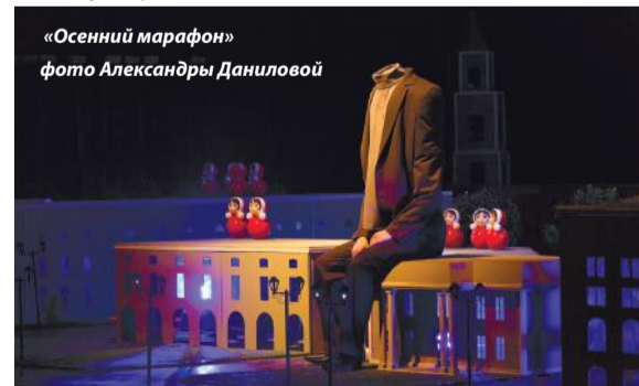
«Осенний марафон»

Предварительные репетиции начались уже в январе, а премьера запланирована на первую декаду апреля.