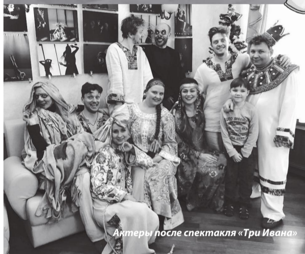
Актеры после спектакля «Три Ивана»