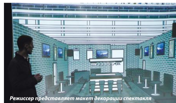
Режиссер представляет макет декорации спектакля