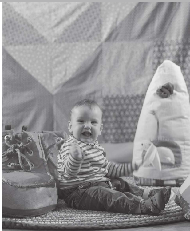
«Терем. Теремок. Теремочек»

Посмотреть новый волшебный спектакль можно будет 24 и 25 февраля.