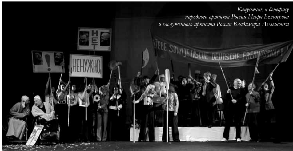
Капустник к бенедикту народного артиста России Игоря Белозерова и заслуженного артиста России Владимира Лемешонко

Настоящую моду на него ввели участники московского Общества искусства и литературы (1888—1891). «Вы идете сегодня на капустник?» — спрашивали друг друга артисты и те, кто был вхож в модные театральные круги. При этом поначалу имелся в виду самый обыкновенный пирог с капустой. Это великопостное блюдо украшало стол на закрытой дружеской пирушке, где актеры в узком кругу хохмили и развлекали друг друга историями в лицах. Уже потом обязательными ингредиентами вечеринки стали пародии на известных лиц и сатирические интермедии на внутритеатральные темы.