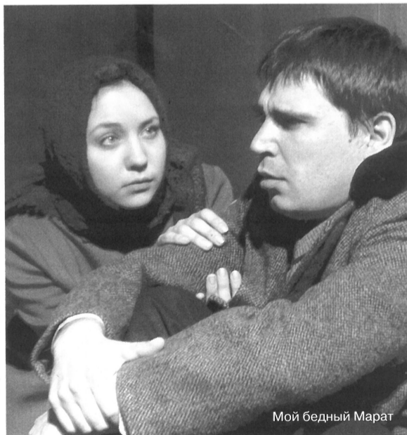
Мой бедный Марат

— Я определила для себя важную вещь: не Барри, Кевина и Нормана надо поддержать перед выступлением, сказать им, что вот сейчас откроется занавес, и они покорают первоклассных