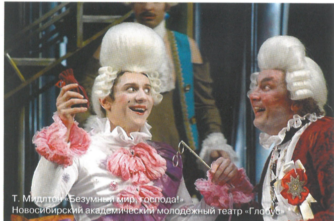
Т. Миддлтон «Безумный мир, господа!» Новосибирский академический молодежный театр «Глобус»

ТОЛЬКО У НАС! РЕПЕРТУАРЫ ВСЕХ ТЕАТРОВ НОВОСИБИРСКА: АПРЕЛЬ 2006