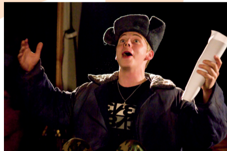
Д. Привалов «ПРЕКРАСНОЕ ДАЛЕКО». Сахалинский театральный центр им. А. Чехова

фия. Очень красивый, эффектный спектакль с очень необычными актерскими работами. Его можно рекомендовать любому зрителю: тут есть и любовная история, и пища для тех, кто любит интеллектуальный и эстетский театр.