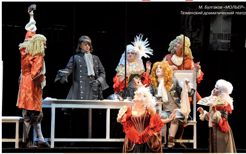
М. Булгаков «МОЛЬЕР». Тюменский драматический театр