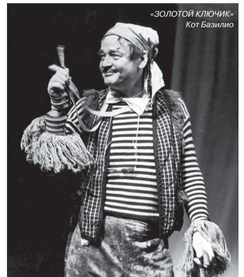
«ЗОЛОТОЙ КЛЮЧИК» Кот Базилио