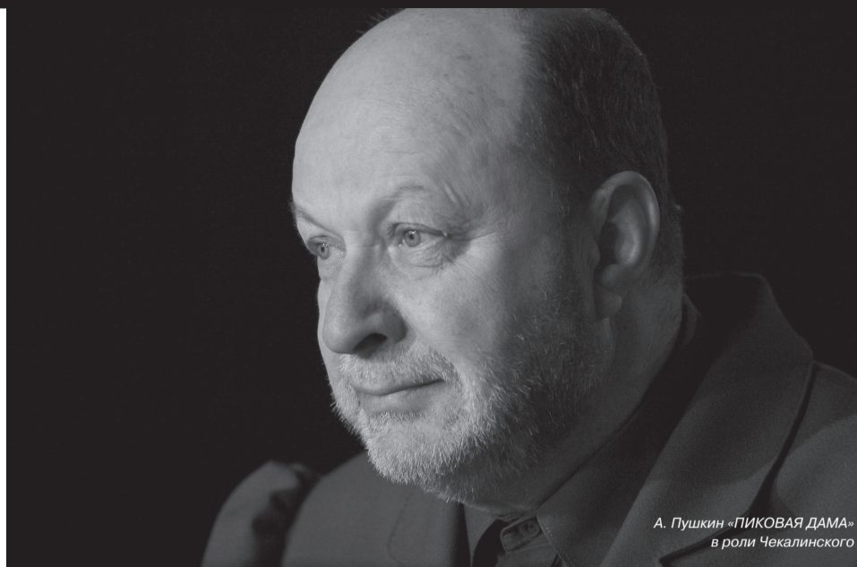
А. Пушкин «ПИКОВАЯ ДАМА» в роли Чекалинского