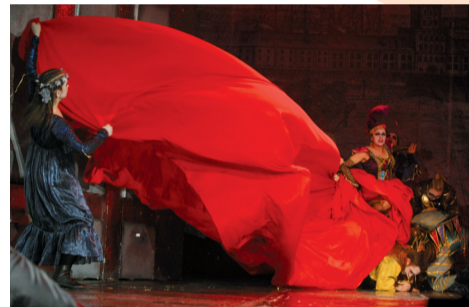
А. Блок «БАЛАГАНЧИК». Челябинский камерный театр