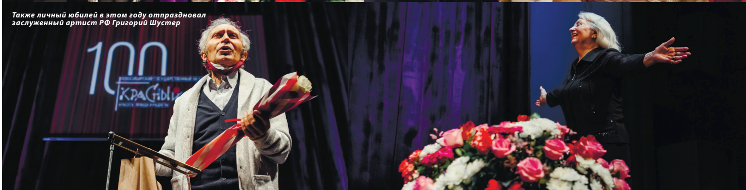
Также личный юбилей в этом году отпраздновал заслуженный артист РФ Григорий Шустер