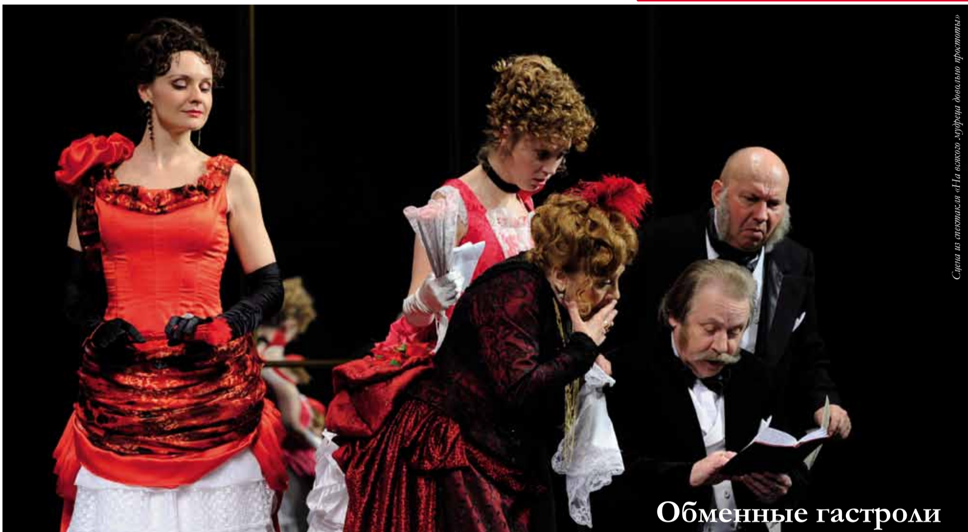
Сцена из спектакля «На всякого мудреца довольно простоты»