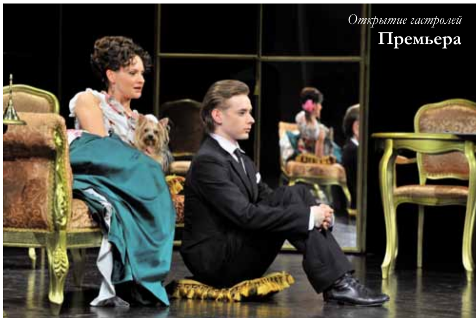
Открытие гастролей Премьера