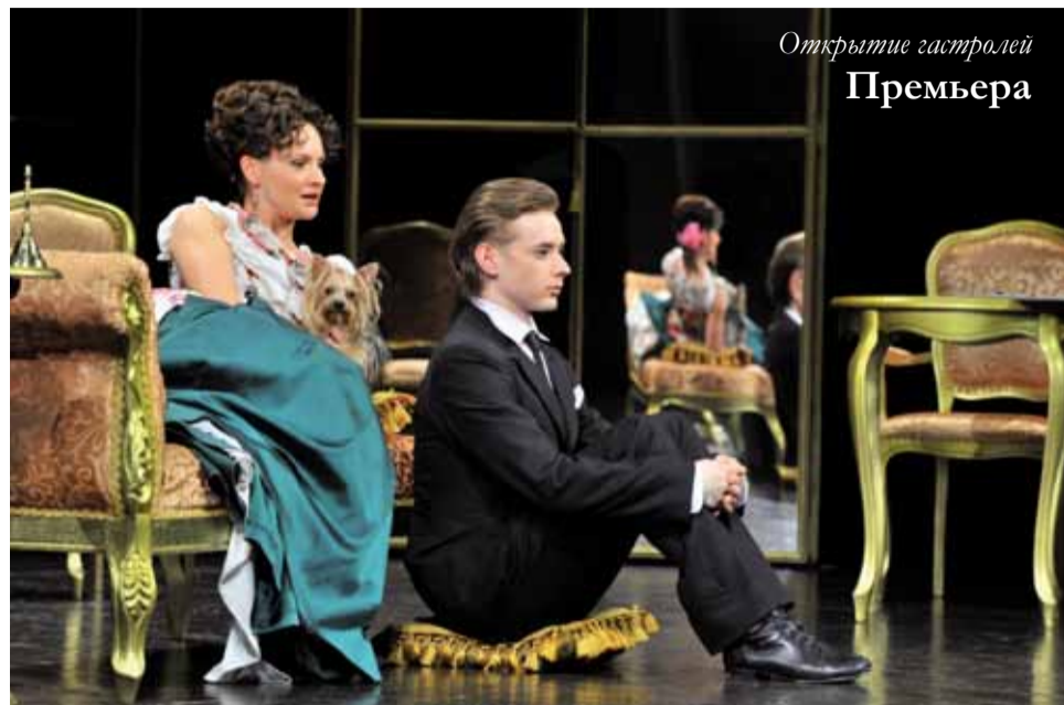
Открытие гастролей Премьера