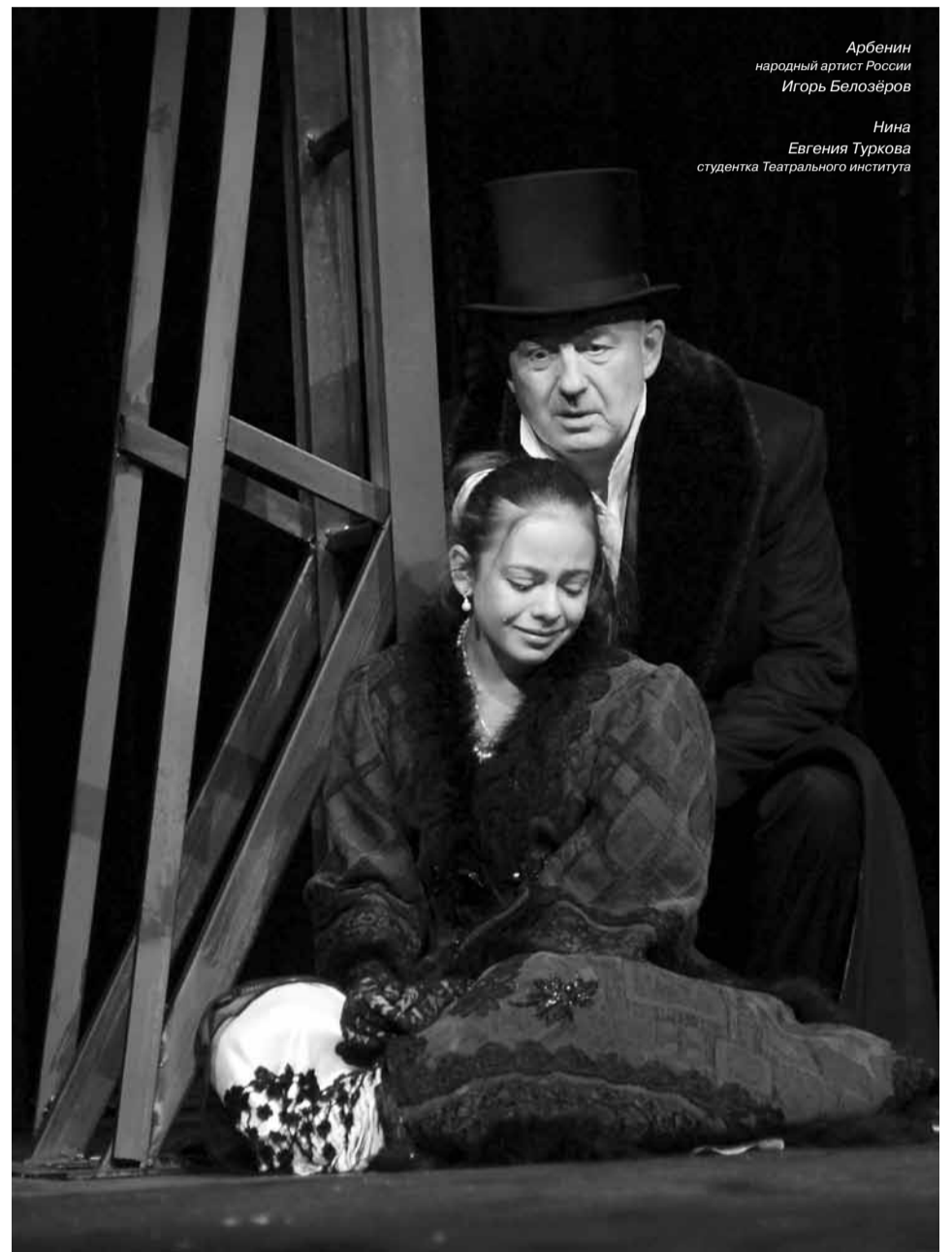
Арбенин народный артист России Игорь Белозёров