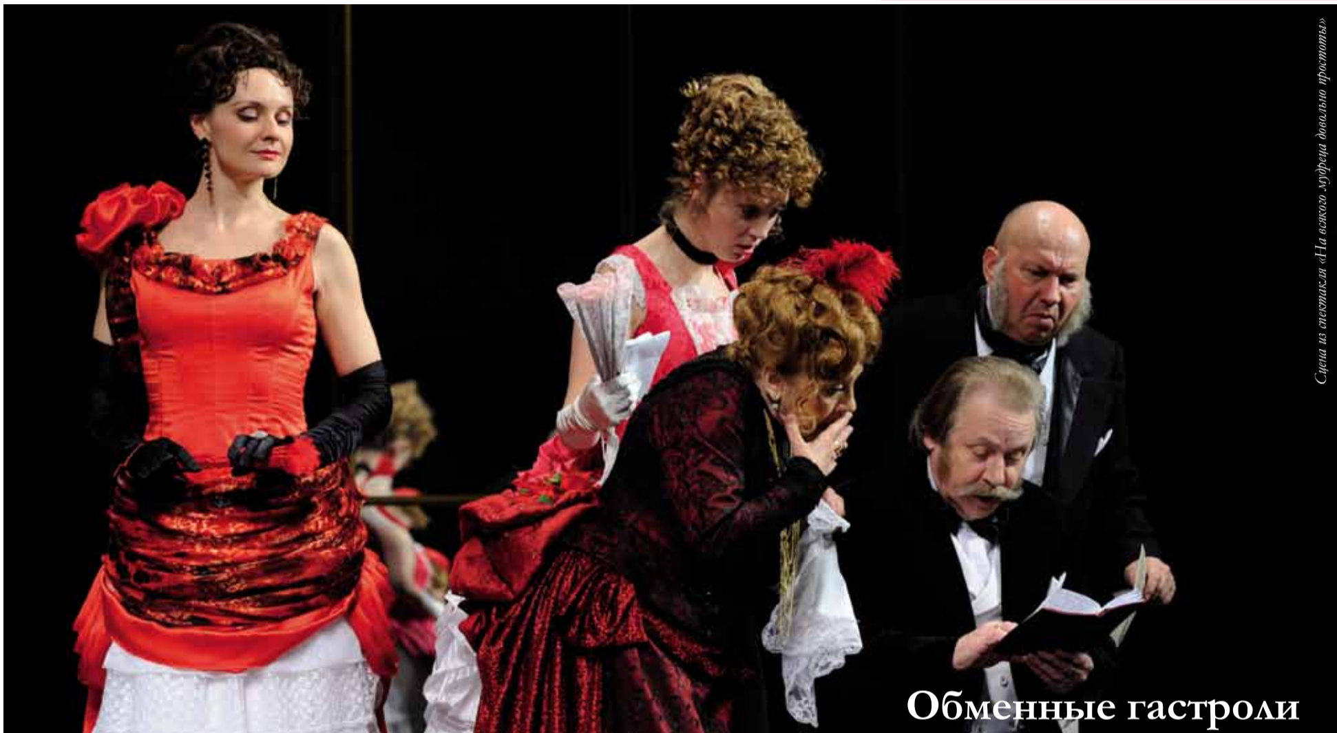
Сцена из спектакля «На всякого мудреца довольно простоты»