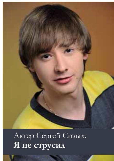
Актер Сергей Сизых: Я не струсил

Свои роли не делю на любимые и нелюбимые. Вернее, те, что даются труднее, кажутся мне неудавшимися, люблю больше, чем те, которые удавались легко. Зачастую не сразу мне открывается стиль автора, то, как он мыслит. Потому каждый спектакль играю, как в первый раз — поиск зерна образа не прекращается.