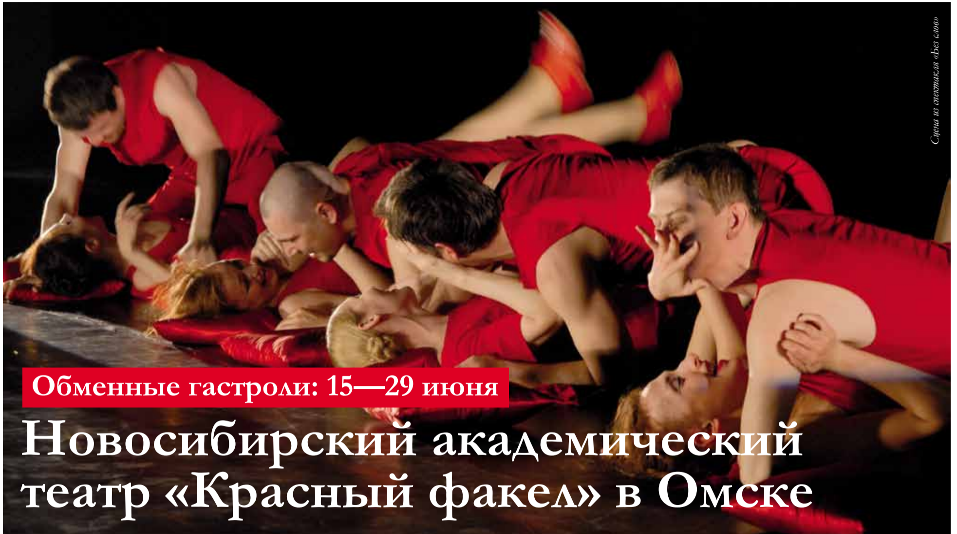
Сцена из спектакля «Без слов»