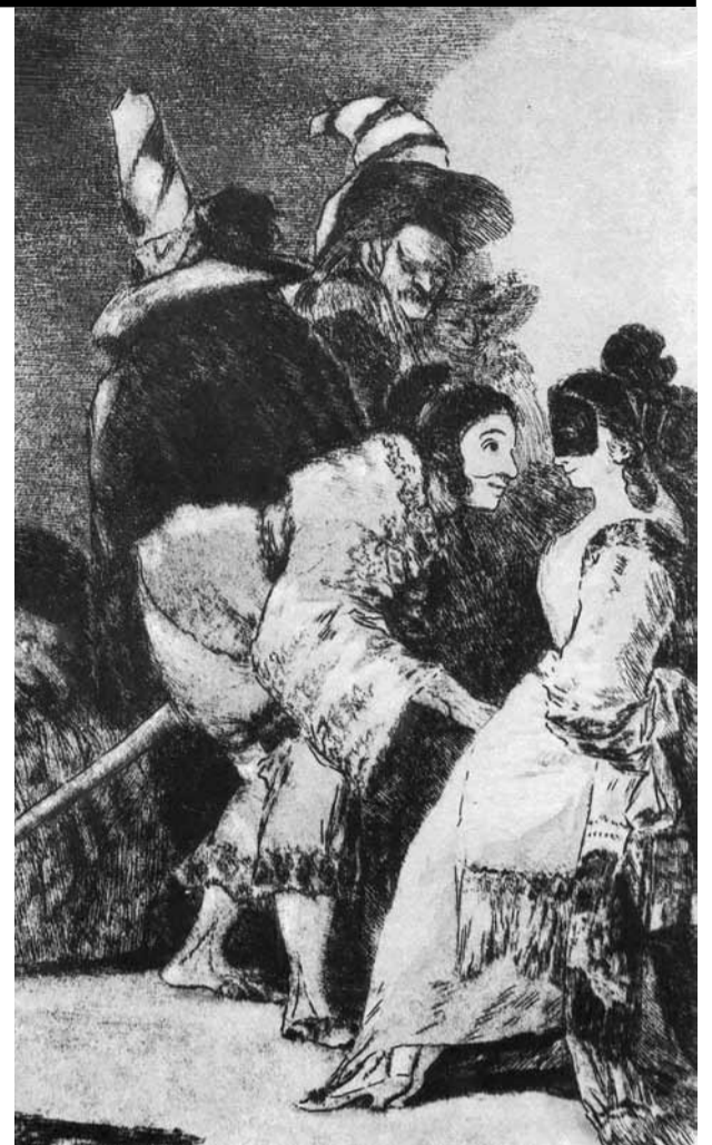
Свет — тот же маскарад. Лицо, одежда и голос — всё в нём притворно. Все хотят казаться не тем, что они есть на самом деле. Все обманывают друг друга, и никого не узнаешь.