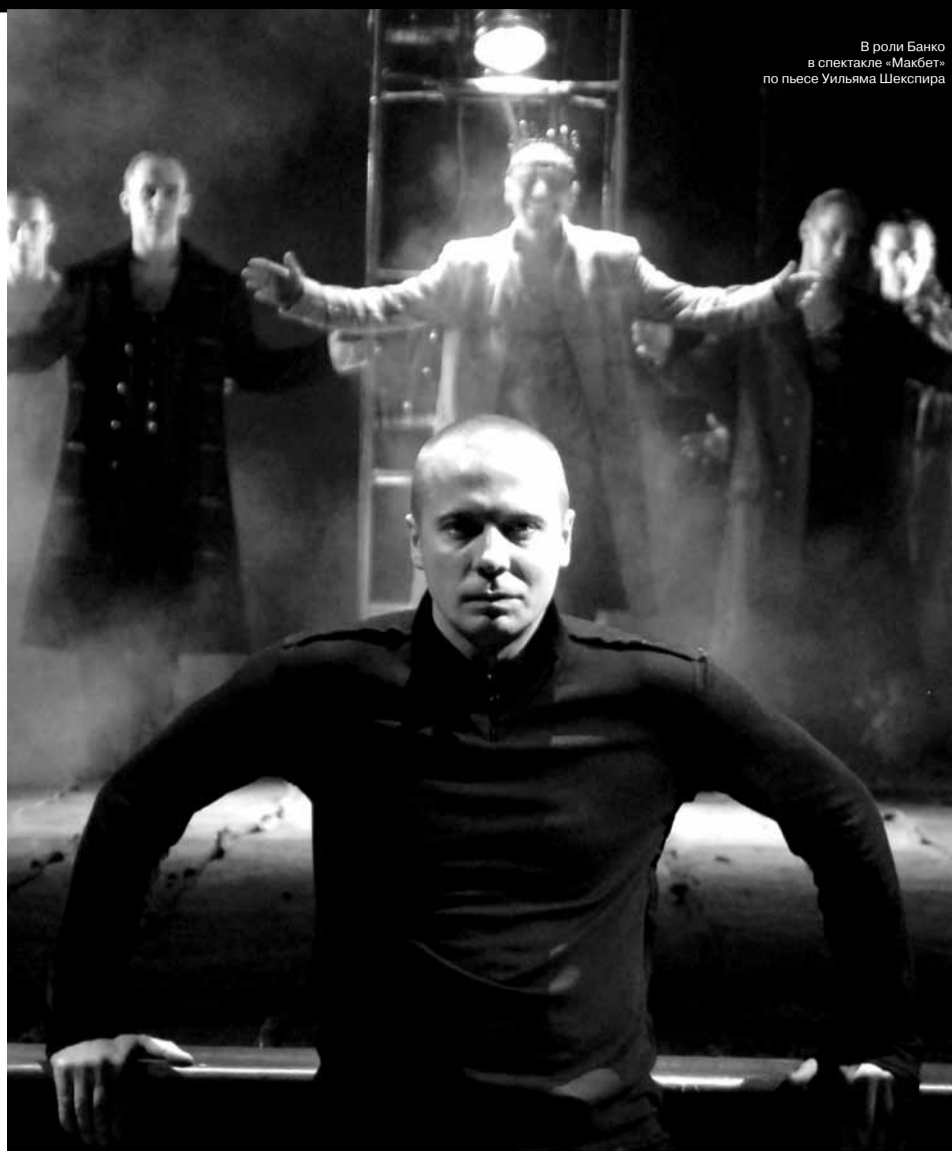
В роли Банко в спектакле «Макбет» по пьесе Уильяма Шекспира

— Честно скажу, не люблю, когда театр называют «храмом»: это звучит так, будто мы здесь отгораживаемся от того, что происходит вокруг. Но наша жизнь вне театра не может не влиять на профессию. Мы в неё всё приносим извне, а театр, в свою очередь, тянется за нами в жизнь. Даже, может быть, и хочешь отвлечься, но всё равно постоянно думаешь о работе. Бессмысленно себя обманывать, что можно от неё отгородиться. Ты вышел из театра, но репетиция продол-