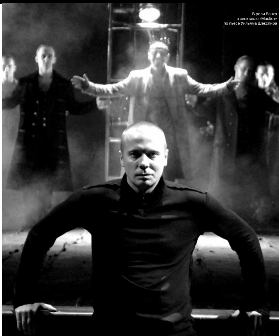
В роли Банко в спектакле «Макбет» по пьесе Уильяма Шекспира

— Честно скажу, не люблю, когда театр называют «храмом»: это звучит так, будто мы здесь отгораживаемся от того, что происходит вокруг. Но наша жизнь вне театра не может не влиять на профессию. Мы в неё всё приносим извне, а театр, в свою очередь, тянется за нами в жизнь. Даже, может быть, и хочешь отвлечься, но всё равно постоянно думаешь о работе. Бессмысленно себя обманывать, что можно от неё отгородиться. Ты вышел из театра, но репетиция продол-